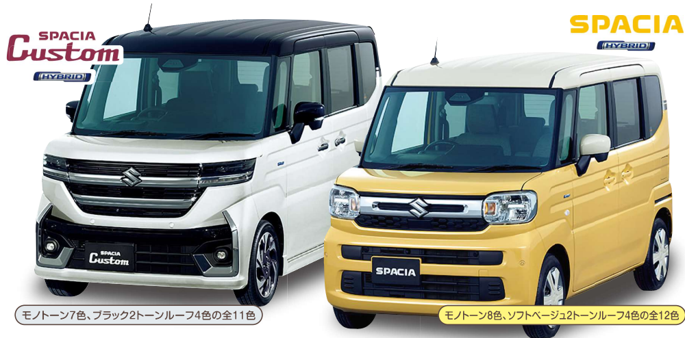
モノトーン7色、ブラック2トーンルーフ4色の全11色 モノトーン8色、ソフトベージュ2トーンルーフ4色の全12色

メーカー希望小売価格(税込) 1,801,800~2,193,400円 メーカー希望小売価格(税込) 1,530,100~1,824,900円